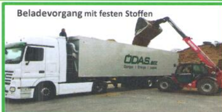
Beladevorgang mit festen Stoffen