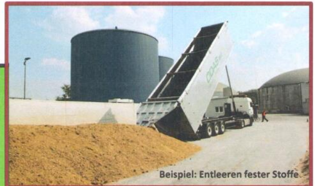
Beispiel: Entleeren fester Stoffe