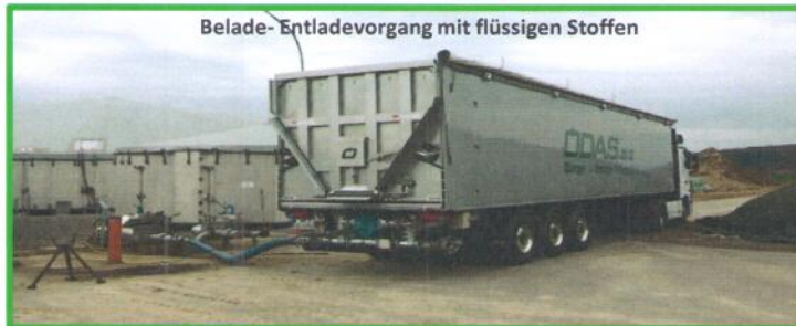
Belade- Entladevorgang mit flüssigen Stoffen